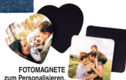
FOTOMAGNETE zum Personalisieren, von Cewe, ab ca. 15 €