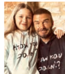
FAMILIENBANDE Ex-Fußballprofi David Beckham verbringt viel Zeit mit seinen Kindern Harper, Cruz und Brooklyn (v.l.)