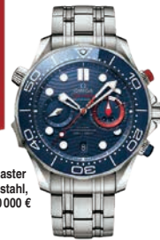
CHRONOGRAF „Seamaster Diver 300M“ aus Edelstahl, von Omega, ca. 10 000 €